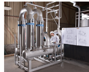
Système de filtration Kleansep™

Les membranes céramiques d'ALSYS sont des filtres en forme de tube avec une structure de membrane asymétrique. Avec leur conception unique, les produits KLEANSEP™ conviennent dans une large gamme d'application.